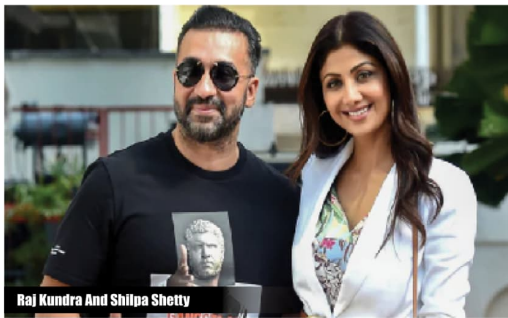
Raj Kundra And Shilpa Shetty

Shilpa Shetty spoke this week for the first time about Kundra's arrest in the production and distribution of pornographic content case. The actress has released a statement on social media and revealed that false quotes are being attributed to her. "Yes! The past few days have been challenging, on every