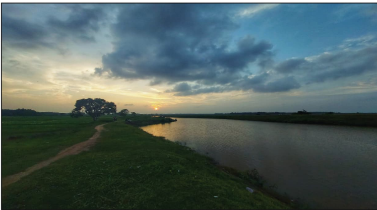
In the middle of nowhere.