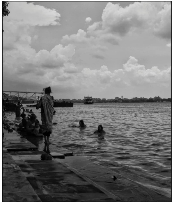
Holy waters.