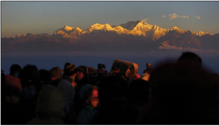
The golden rays of the sun lights up Kanchenjunga.