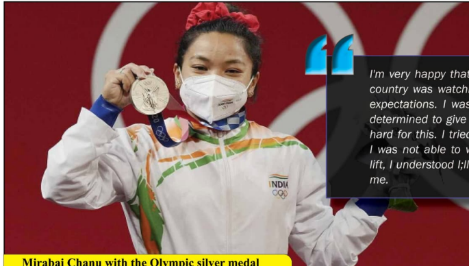
Mirabai Chanu with the Olympic silver medal

Asking in glory after her Tokyo triumph, Mirabai Chanu is aware of how different the scenario would have been had she missed out on her attempts on the weightlifting platform, where she won India's first medal in the 2020 Olympics.