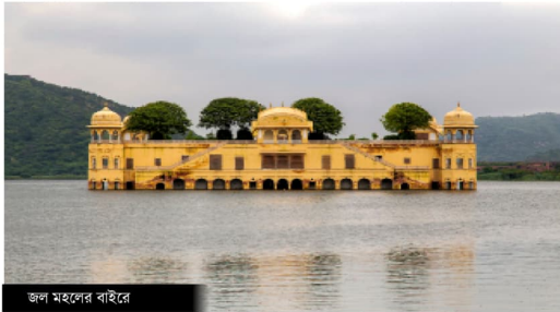
জলা মহলের বাইরে

পৌছানো জয়পুরের সিটি প্যালেসে। এখানে পাথরের কাজ ও দেওয়ালগুলোতে বিভিন্ন রকমের রঙিন কাঁচ বসিয়ে যে কারুকার্য করা হয়েছে তা আজও অক্ষত আছে। প্রাসাদের প্রতিটি ঘর ও বাগানদার নির্মিতের কাজ এতটাই সুন্দর যে, তা দেখলে সবাই বিস্মৃত হন।