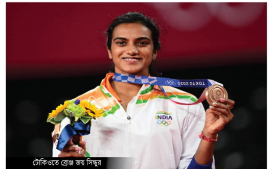
টোকিওতে ব্রোঞ্জ জয় সিন্ধুর