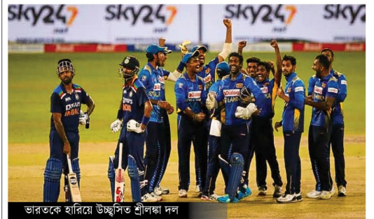
ভারতকে হারিয়ে উচ্ছ্বসিত শ্রীলংকা দল