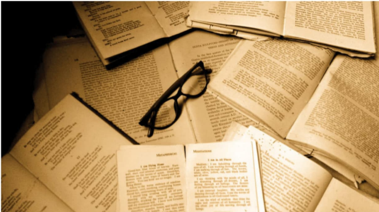
A storehouse of knowledge.