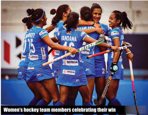
Women's hockey team members celebrating their win

Drag-flicker Gurjit Kaur put India ahead in the second minute but Argentina's skipper Maria Noel Barrionuevo scored a brace to help her team emerge 2-1 winners and reach the final. India will play Great Britain for the bronze medal on Friday. Last week, the team kept its hopes of progressing to the knouts alive with a crunch 4-3 win over South Africa. This was a crucial win for India